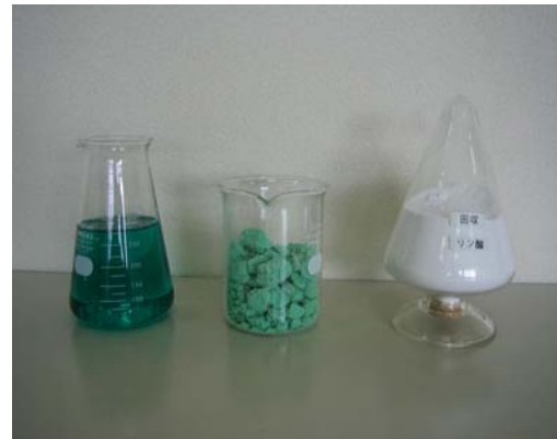
(上图)从左依次为无电解镀镍废液 固体镍化合物粉末状加工磷。