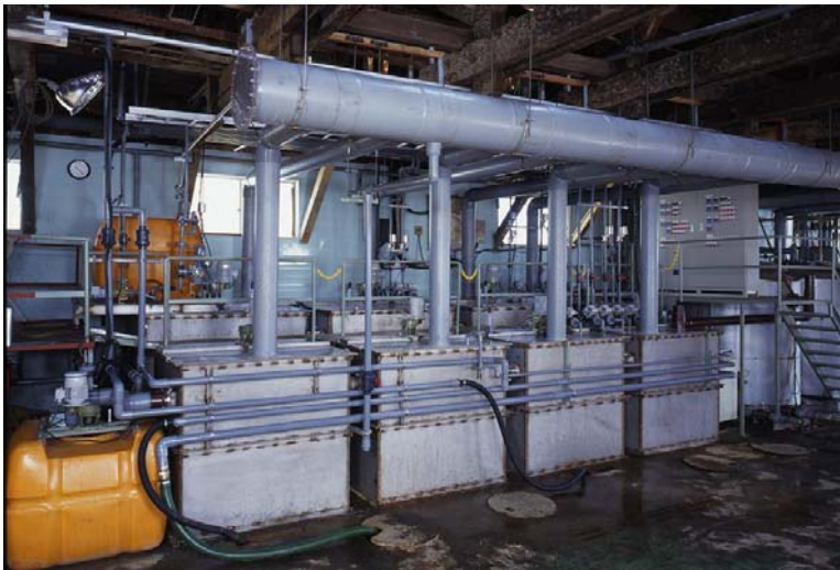
(无电解镀镍废液处理装置)