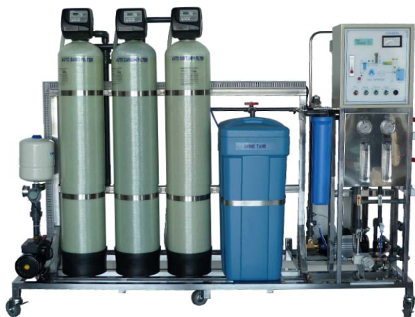
※图片中土带有软水瓶的装置（自由选择）